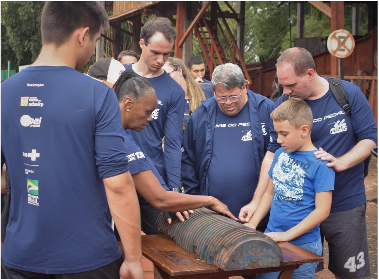
2. Grupo de visitas da Instituição Educação Especial Exclusiva do Centro de Recursos e Apoio pedagógico CRAP