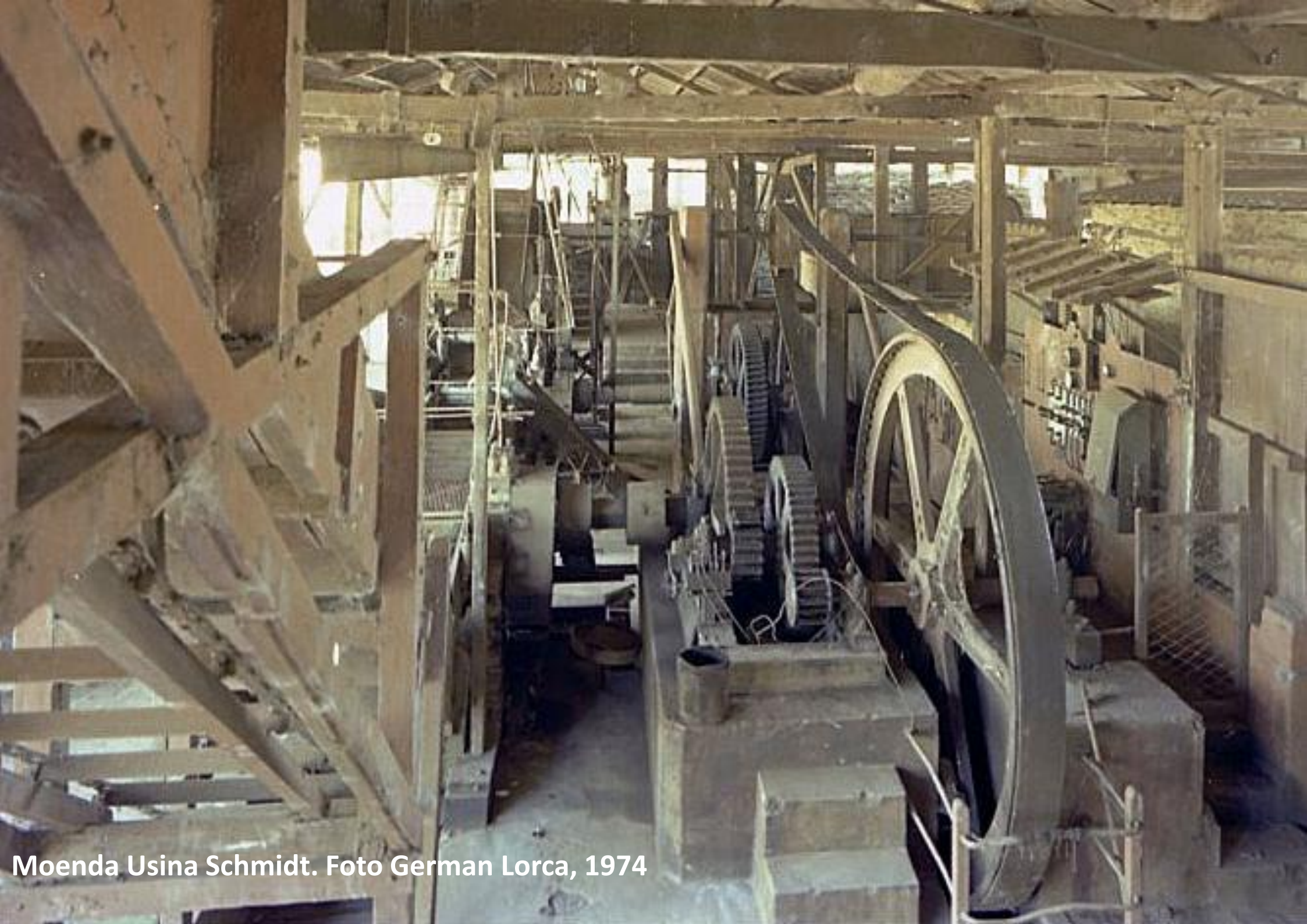
Moenda Usina Schmidt. 1974